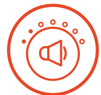
Bajo Nivel de Ruido