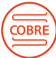
Serpentín de Cobre